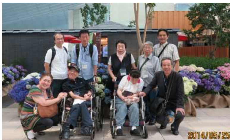
昨年は京急線沿線でした。