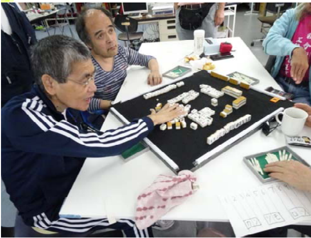
↑結果発表後、直ぐに牌を崩してる所。