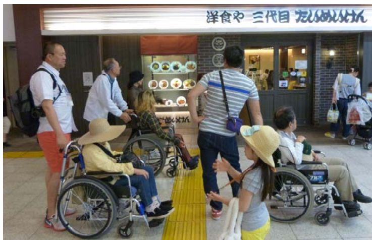
↑ 同じく2016年外に出よう(駅のバリアフリー調査)