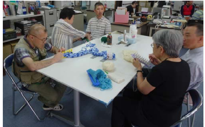
↑手芸部で何かを製作中・・・。