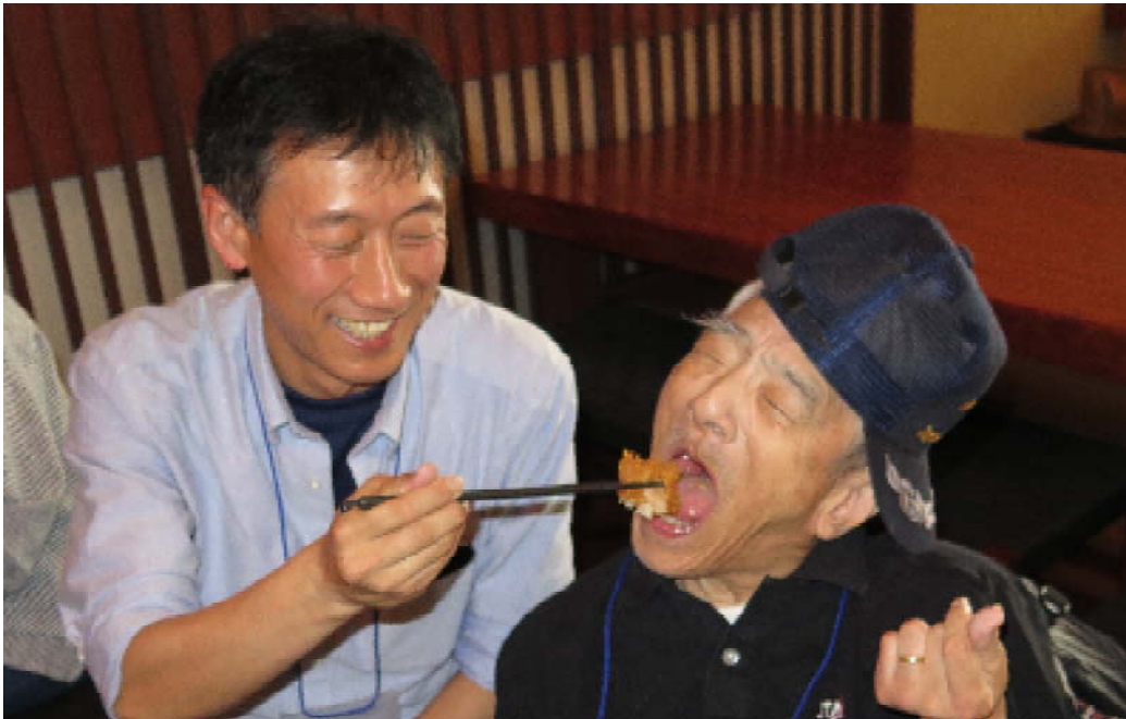
↑平成26年の外に出よう

⑧、留守番・電話対応（職員が送迎に出てる間の留守番，午前9時00分～11時30分）