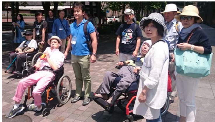
↑ 2016年外に出よう(駅のバリアフリー調査)にて