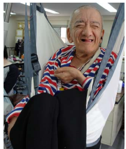
↑今は笑いしわの絶えない、優しいおじいちゃん。