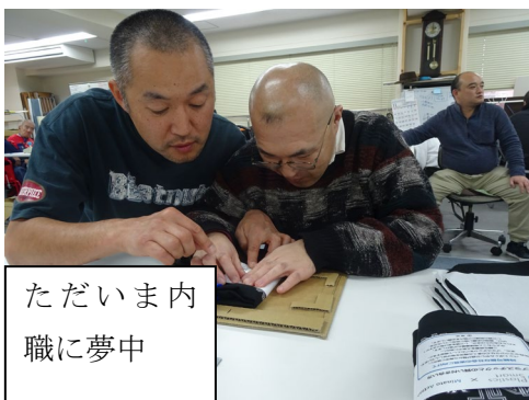
ただいま内 職に夢中