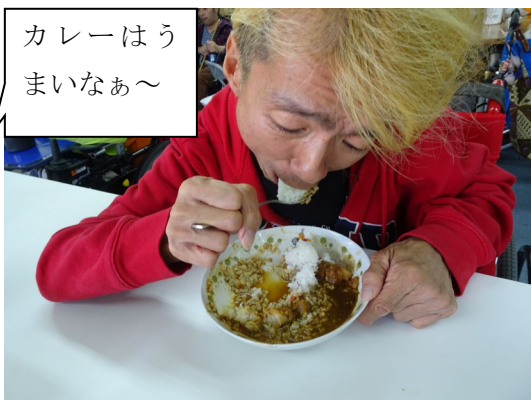
カレーはう まいなあ～