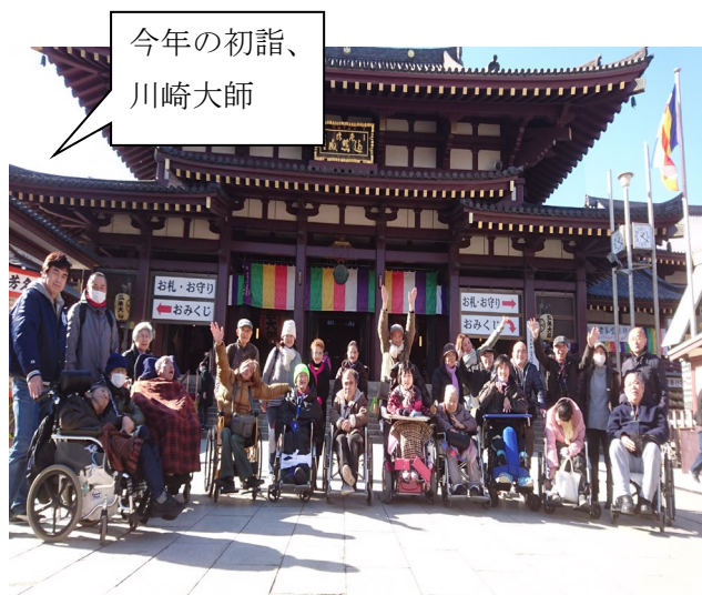
今年の初詣、 川崎大師