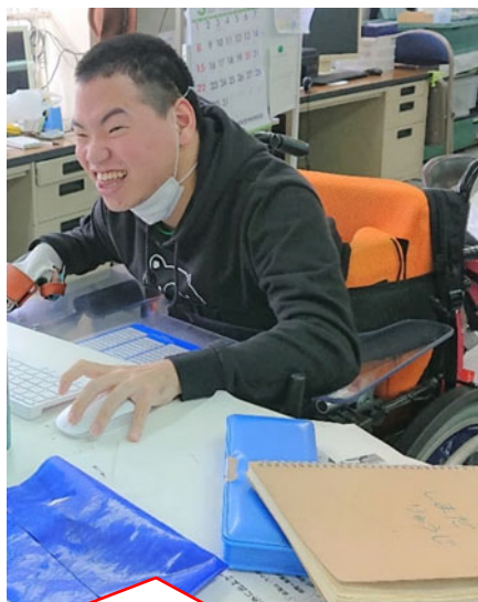
僕は企画の仕事をしています。

③僕にとっては今年も区民祭りが2年連続で中止になりました。非常に残念です。とても悔しかったです。来年は必ず区民祭りをやりたいです。僕がやりたい担当は古本屋さんをやりたいです。