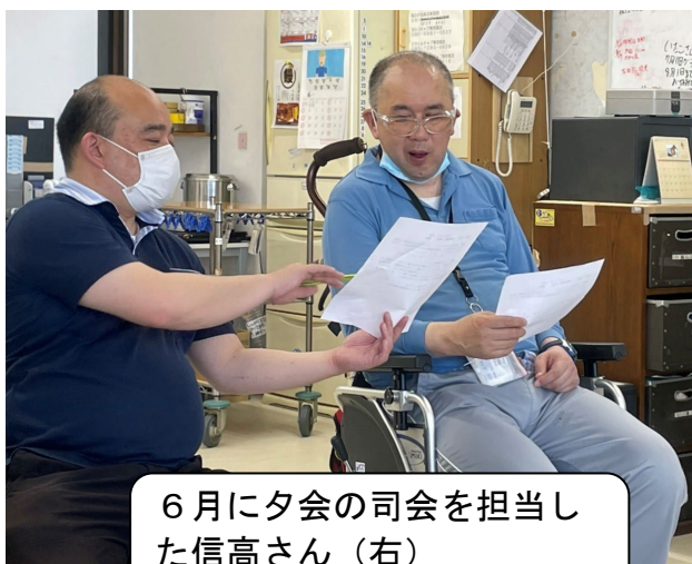
6月に夕会の司会を担当した信高さん(右)