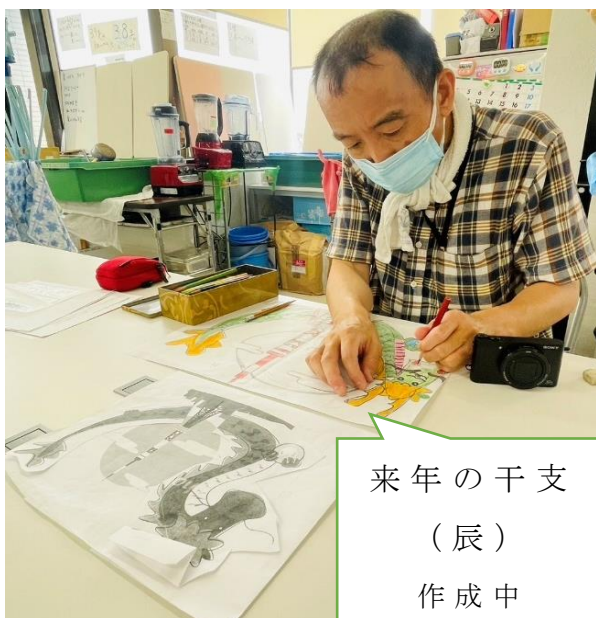
来年の干支 （辰） 作成中