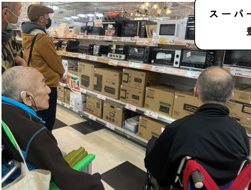
スーパービバホーム 豊洲店