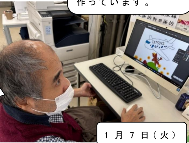
パソコンでイラストレーターをやってみたけど、じぶんでイメージしたデザインを頭に描いて描いてみました。